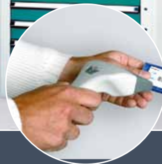
... oder mit Scanner