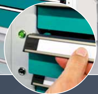
③ Kontrollleuchte grün: Schublade öffnen