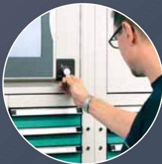
① Anmelden mit Badge