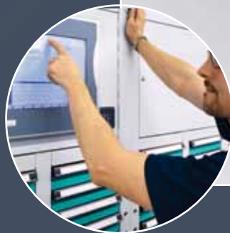
② Artikel auswählen auf dem Touch-Screen ...